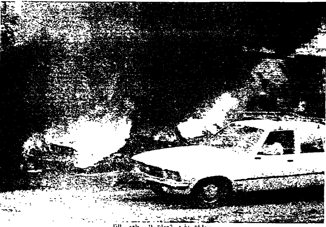
سيارات تحترق في طعم النار

عون يتوقع نهاية سريعة للموضع وجعجع يؤكد عدم امكان تجاهل سوريا في حل الازمة